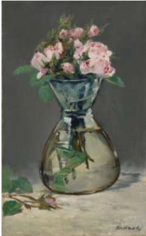
Édouard Manet (1832–1883) Roses mousseuses dans un vase, 1882 Huile sur toile, 55.9 x 34.6 cm