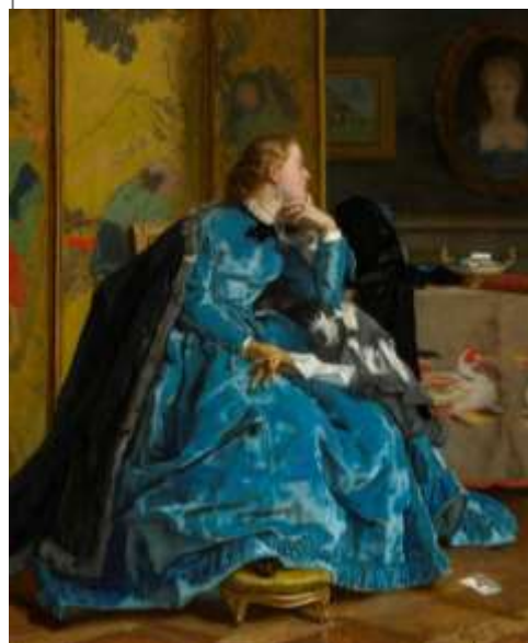
Alfred Stevens (1823–1906) Duchesse (en robe bleue), c. 1866 Huile sur bois, 31,4 x 26 cm