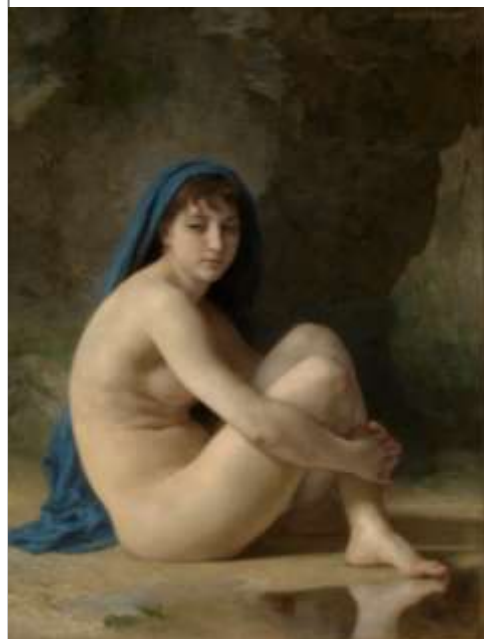
William-Adolphe Bouguereau (1825–1905)

Peindre la forêt et la campagne constituait pour ces artistes un défi lancé au monde de l'art officiel qui tenait le paysage pour un sujet inférieur. Leur audace allait inspirer les générations suivantes, en particulier les impressionnistes.