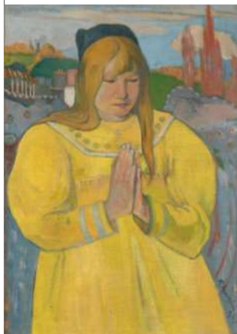
Paul Gauguin (1848–1903) Jeune Chrétienne, 1894 Huile sur toile, 65,3 x 46,7 cm