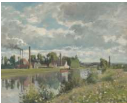
Camille Pissarro (1830–1903) L'Oise aux environs de Pontoise, 1873 Huile sur toile, 46 x 55,7 cm