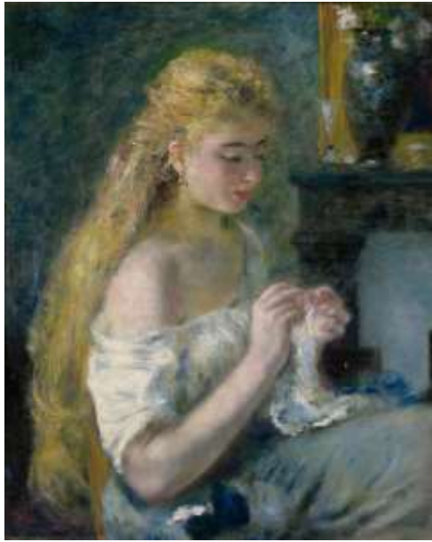
Pierre-Auguste Renoir (1841–1919)