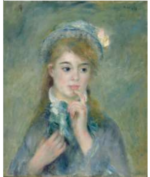
Pierre-Auguste Renoir (1841-1919) L'Ingénue, 1874 Huile sur toile, 55,97x 46,4 cm