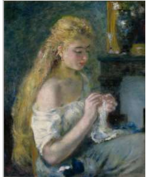
Pierre-Auguste Renoir (1841– 1919) Jeune Femme au crochet, 1875 Huile sur toile, 73,5 x 60,3 cm