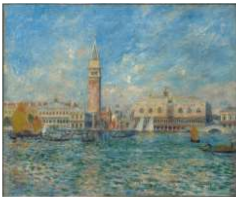
Pierre-Auguste Renoir (1841–1919)