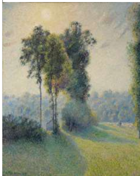
Camille Pissarro (1830–1903) Saint-Charles, Éragny , 1891 Huile sur toile, 81 x 65cm

Acquis par le Clark Institute, Femmes au chien de Bonnard et Jeune Chrétienne de Gauguin complètent la collection et annoncent les expérimentations abstraites du XX e siècle.