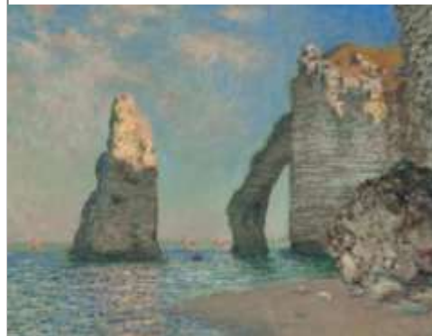
Claude Monet (1840–1926) Les Falaises à Étretat, 1885 Huile sur toile, 65,1 x 81,3 cm

Notons aussi qu'ils appréciaient particulièrement les images de femmes séduisantes, quel que fût le style de l'artiste. L'exposition en réunit toute une palette, composée des figures sensuelles de Bouguereau ( Nu assis ) et surtout de Renoir ( Baigneuse blonde ). Sans oublier les Parisiennes élégantes, décrites par Giovanni Boldini ( En traversant la rue ), Alfred Stevens ( Duchesse -en robe bleue ) ou James Tissot dont ils acquirent le remarquable Chrysanthèmes .