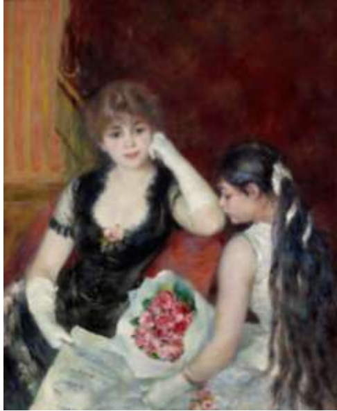
Pierre-Auguste Renoir (1841–1919) Une loge au théâtre (Au concert), 1880 Huile sur toile, 99,4 x 80,7 cm.