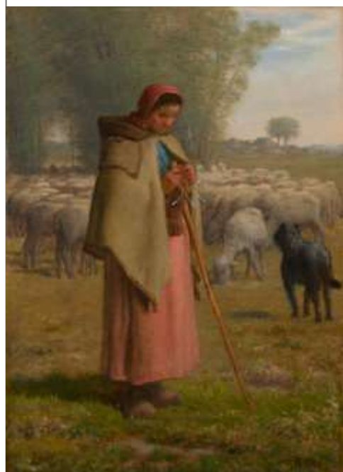
Jean-François Millet (1814–1875)

La Bergère: les plaines de Barbizon , avant 1862