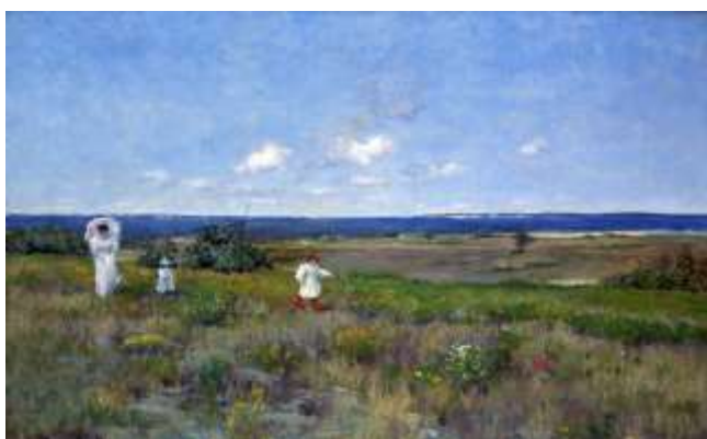
William Merritt Chase Près de la plage, Shinnecock, 1895

Au début des années 1890, les couleurs prismatiques, la touche fragmentée et les ombres mauves s'imposent dans les expositions organisées à New York, Philadelphie et Boston. Les artistes rentrés aux États-Unis après avoir étudié en Europe cherchent à adapter l'impressionnisme à leur nouveau public en choisissant des sujets de leur pays natal. En 1887-1888, William Merritt Chase abandonne sa palette sombre pour créer une série de scènes de jardins publics aux couleurs vives. Dans les années 1890, pendant les étés qu'il passe sur la côte de Long Island, il poursuit dans cette voie en travaillant en plein air. Hassam, Robinson et Dennis Miller Bunker, peignent quant à eux New York, les villages de Nouvelle-