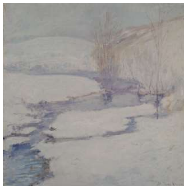
John Henry Twachtman Paysage d'hiver , 1890-1900

Huile sur toile, 76,5 x 76,5 cm Chicago, Terra Foundation for American Art, collection Daniel J. Terra, 1992.136