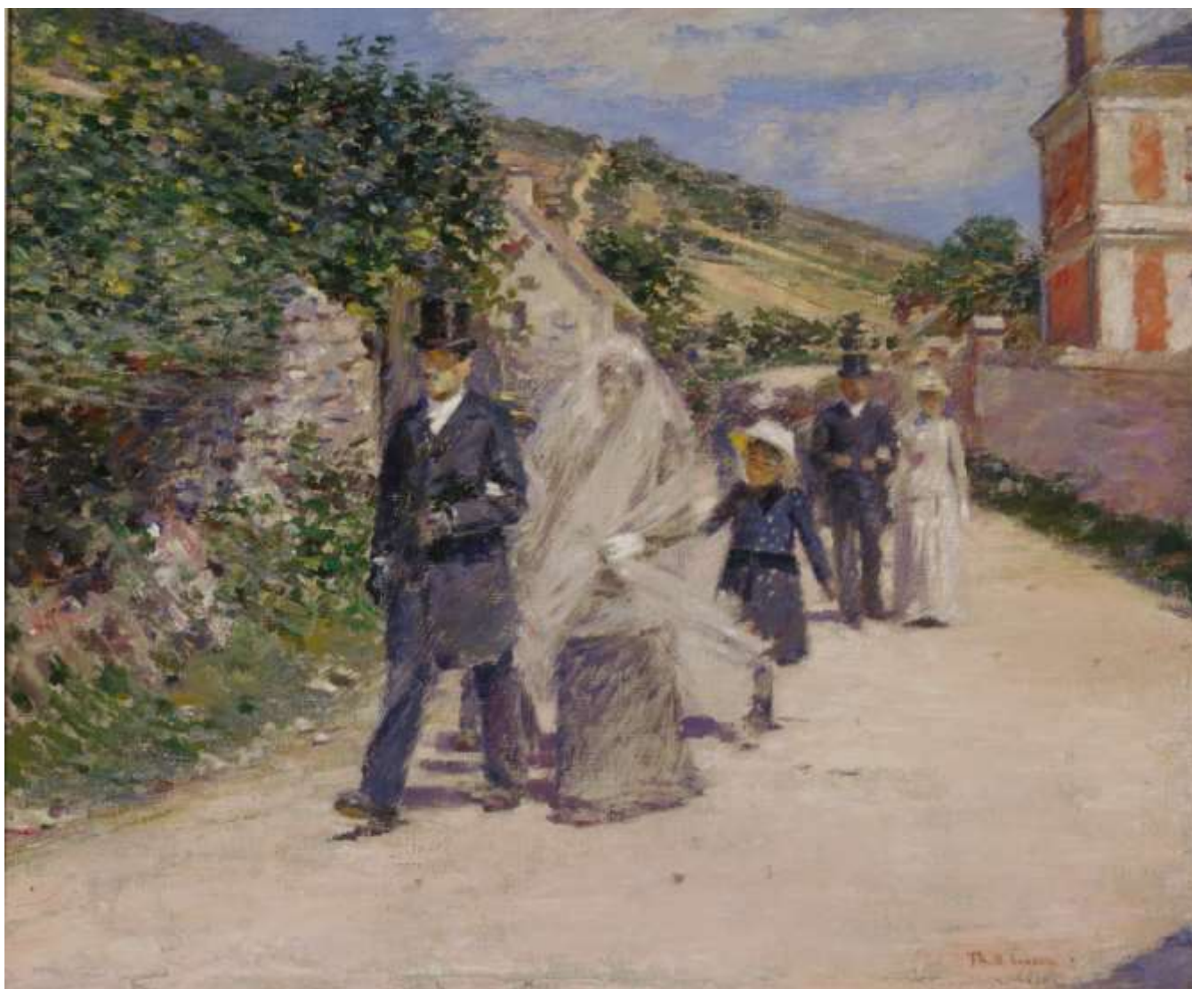
Theodore Robinson Le Cortège nuptial, 1892

— Huile sur toile, 56,7 x 67,3 cm Chicago, Terra Foundation for American Art, Collection Daniel J. Terra, 1999.127