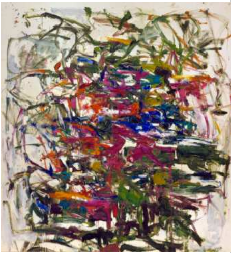
Joan Mitchell, Untitled , 1957 New York, Joan Mitchell Foundation © Estate of Joan Mitchell