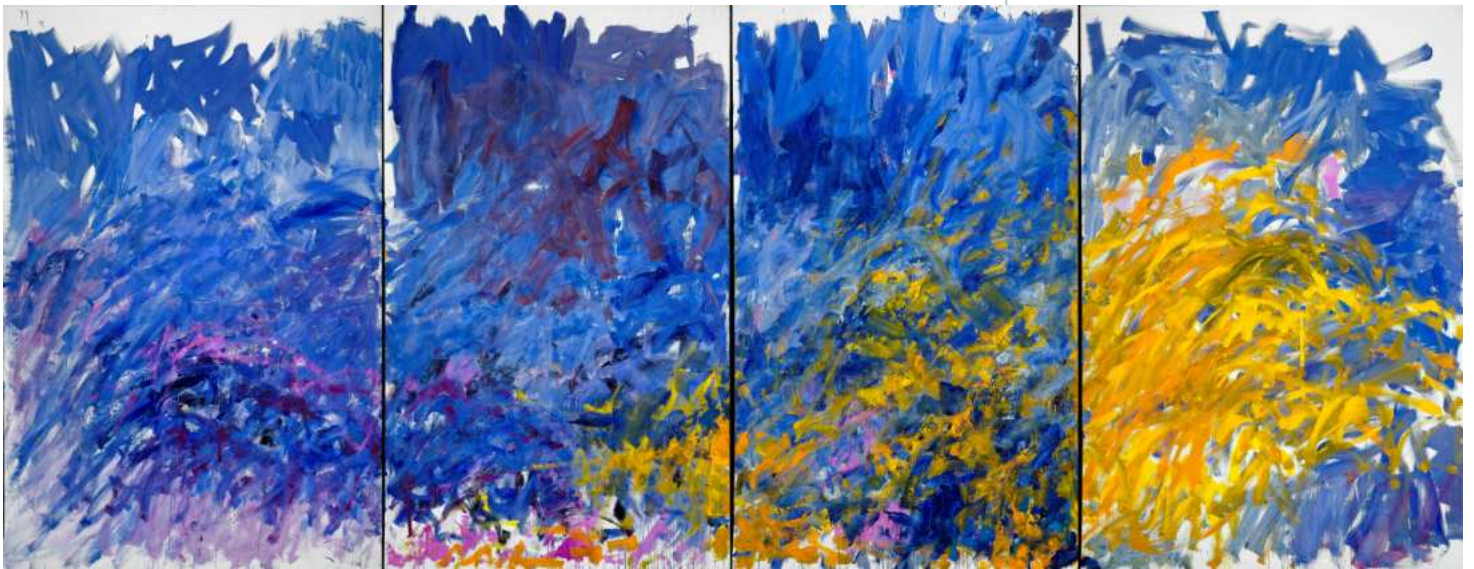
Joan Mitchell, Edrita Fried, 1981 Joan Mitchell Foundation

particulier, orchestrent une vision presque cinématographique où la peinture domine le spectateur et se structure en séquences. La fine ligne de rupture rappelle au moment même où l'expérience de la peinture environne le spectateur, le saisit de toute part, que la discontinuité lui est consubstantielle.