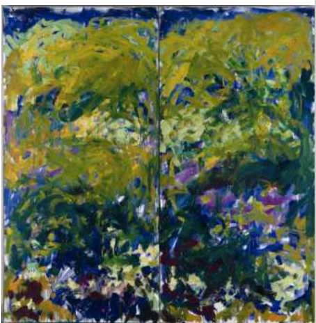
Joan Mitchell, La Grande Vallée IX , 1983 © collection FRAC Haute-Normandie