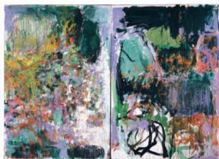
Joan Mitchell, Un jardin pour Audrey , 1979

Collection particulière