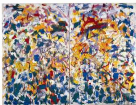
Joan Mitchell, Sud, 1990 Collection particulière

A travers ses polyptyques, tout se passe comme si Joan Mitchell ne voulait pas choisir : vivre à Vétheuil, et parler de paysages la rattachent à la tradition impressionniste, manier la peinture avec autant de virulence que de virtuosité fait d'elle une artiste moderne, la disposer sur une série de panneaux monumentaux et disjoints, à jamais liés, à jamais séparés, c'est accentuer sa théâtralité phénoménologique.