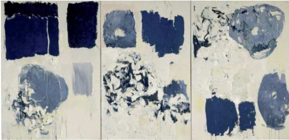
Joan Mitchell, Les Bleuets , 1973 Paris, Musée national d'Art Moderne