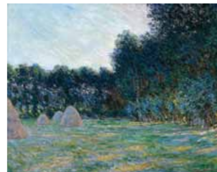
Claude Monet Prairie aux meules de foin près de Giverny , 1885 - Huile sur toile, 74 x 93,5 cm Boston, Museum of Fine Arts, legs de M. Arthur Tracy Cabot, 42.541