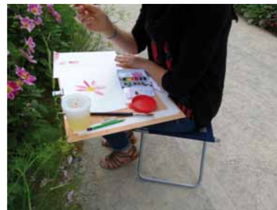
Atelier pour adultes - © mdig