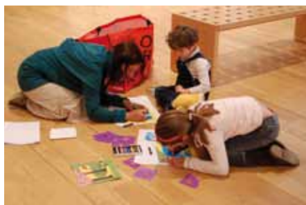
Atelier enfants dans les salles d'exposition