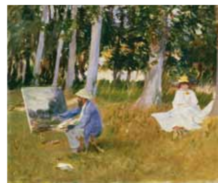
John Singer Sargent Claude Monet peignant à l'orée d'un bois , 1885 - Huile sur toile, 54 x 64,8 cm Londres, Tate, offert par M lle Emily Sargent et M me Ormond par l'intermédiaire du Fonds artistique, 1925, N°4103