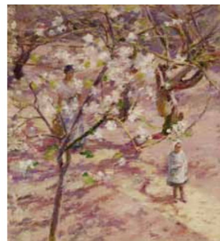
Theodore Robinson Arbres en fleurs à Giverny, 1891-1892 - Huile sur toile, 54,9 x 51,1 cm Chicago, Terra Foundation for American Art, Collection Daniel J. Terra, 1992.130