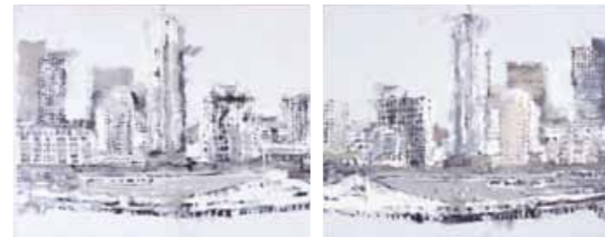
Philippe Cognée Seattle, 2002 - Encaustique sur toile diptyque. © Adagp, Paris

« un espace pour une œuvre » espace destiné à présenter, en dialogue avec les expositions du musée des impressionnistes, une œuvre du Fonds Régional d'Art Contemporain de Haute-Normandie.