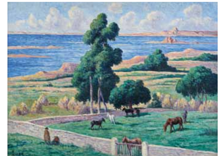
Maximilien Luce L'Île à bois, Kermouster, Lézardrieux, 1914 - Huile sur toile, 97 x 130,5 cm Giverny, musée des impressionnismes, donation D. Ledebt, 2011, MDIG 2011.1.2

Les œuvres présentées pourront évoluer chaque année selon les prêts, mais le thème de l'accrochage restera inchangé. Ainsi, à chaque saison, les visiteurs auront le plaisir d'admirer, en plus de nos expositions temporaires, des œuvres sur le thème de l'impressionnisme.