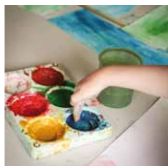
Ateliers enfants