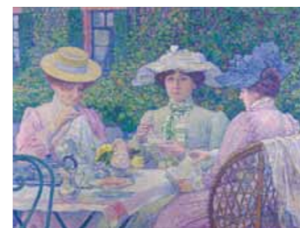
Théo Van Rysselberghe Le Thé au jardin , 1903 - Huile sur toile, 98 x 130 cm Bruxelles, musée d'Ixelles