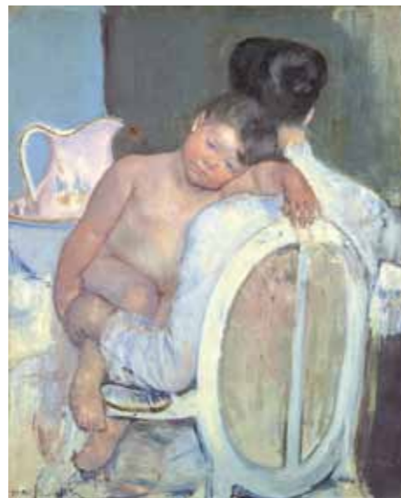
Mary Cassatt Femme assise avec un enfant dans les bras , vers 1890 - Huile sur toile, 81 x 65,5 cm Bilbao, Museo de Bellas Artes de Bilbao