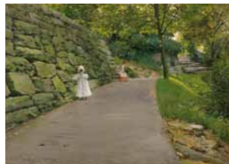
William Merritt Chase Dans le parc , 1889 - Huile sur toile, 35,5 x 49 cm Madrid, Collection Carmen Thyssen-Bornemisza, en prêt au Museo Thyssen-Bornemisza, CTB, 1979.15