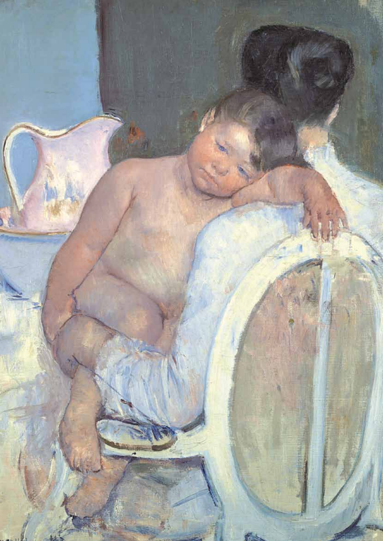
Mary Cassatt Femme assise avec un enfant dans les bras, vers 1890 (détail) - Bilbao, Museo de Bellas Artes de Bilbao