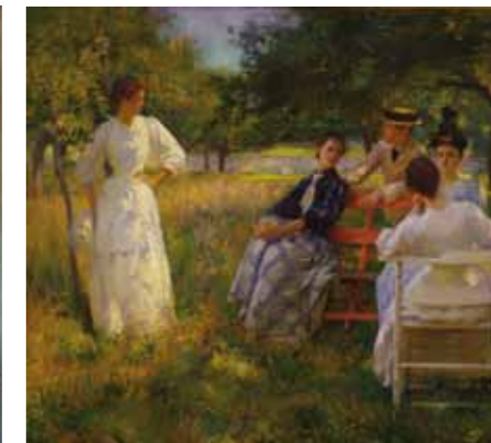
Edmund C. Tarbell Au verger , 1891 - Huile sur toile, 154,3 x 166,4 cm Chicago, Terra Foundation for American Art, Collection Daniel J. Terra, 1999.141