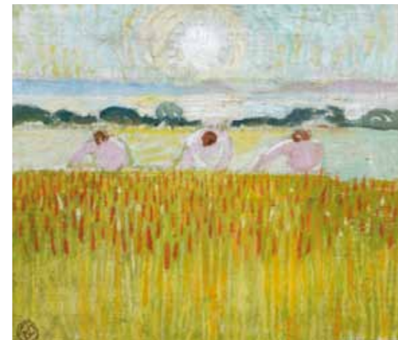
Maurice Denis Soleil blanc sur les blés, vers 1914 - Huile sur toile, 29 x 34 cm Giverny, musée des impressionnismes, don de Claire Denis, MDIG D 2012.6

Le musée des impressionnismes présente, en marge de ses expositions, un accrochage centré autour de quelques tableaux de Claude Monet.