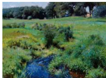
Dennis Miller Bunker La Mare, Medfield , 1889 - Huile sur toile, 47 x 61,6 cm Boston, Museum of Fine Arts, Fonds Emily L. Ainsley, 45.475