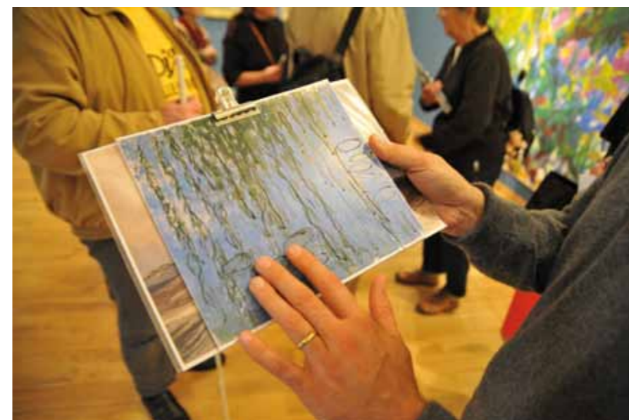
Visite pour les personnes déficiences visuelles

Offre et renseignements sur www.culturesducoeur.org