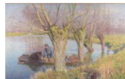
Emile Claus La Levée des nasses , 1893 - Huile sur toile, 130 x 200 cm Bruxelles, musée d'Ixelles