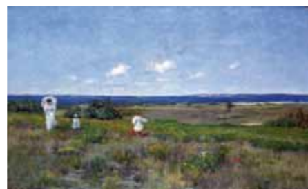
William Merritt Chase Près de la plage, Shinnecock , 1895 - Huile sur toile, 76,2 x 122,2 cm Toledo, Ohio, Toledo Museum of Art, don d'Arthur J. Secor, 1924.58