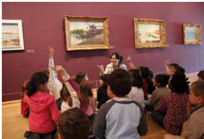
Visite scolaire dans les salles d'exposition

Gratuit . Sans réservation. Dans la limite des places disponibles