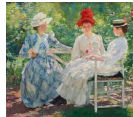
Edmund C. Tarbell Trois sœurs - Étude de la lumière de juin , 1890 - Huile sur toile, 89,2 x 101,9 cm Milwaukee, Wisconsin, Milwaukee Art Museum, don de Mme Montgomery Sears, M1925.1