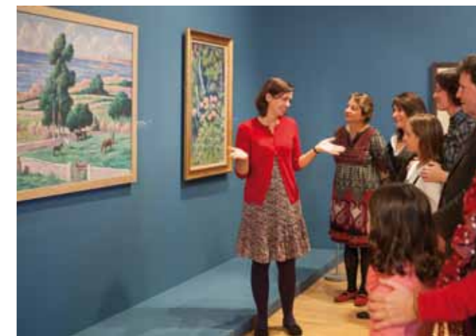
Visiteurs dans les salles d'exposition