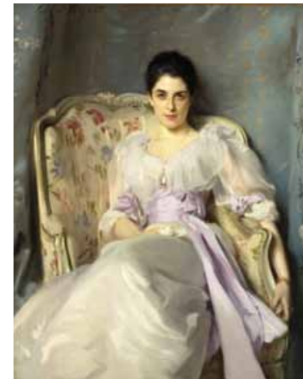
John Singer Sargent Lady Agnew de Lochnaw , 1892 - Huile sur toile, 127 x 101 cm Édimbourg, Scottish National Gallery, NG 1656