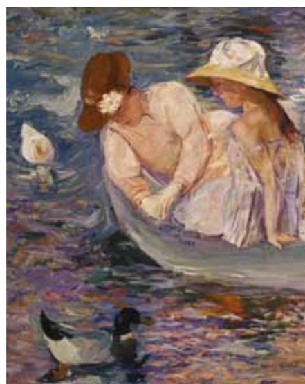
Mary Cassatt L'Été , 1894 - Huile sur toile, 100,6 x 81,3 cm Chicago, Terra Foundation for American Art, Collection Daniel J. Terra, 1988.25