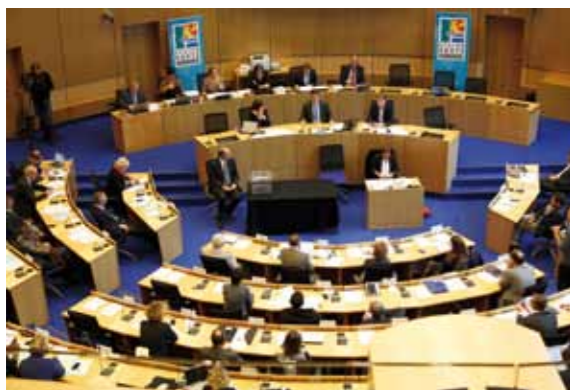
Hémicycle de l'Hôtel de région