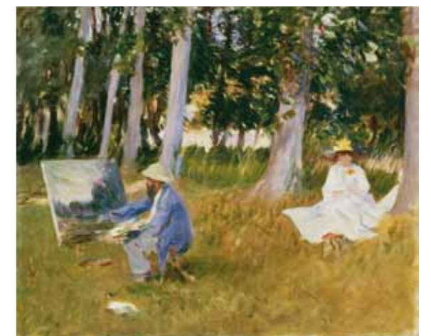
John Singer Sargent Claude Monet peignant à l'orée d'un bois, 1885 Londres, Tate, offert par M me Emily Sargent et M me Ormond par l'intermédiaire du Fonds artistique, 1925, N°4103

Dans sa série d'esquisses de meules de foin directement inspirées de celles du peintre français, il s'exerce à saisir les fluctuations de la lumière. Quant à Childe Hassam, il découvre l'impressionnisme lors du séjour qu'il fait à Paris entre 1886 et 1889. C'est avec des tableaux comme Le Jour du Grand Prix , peint pour le Salon de 1888, qu'il commence à expérimenter des couleurs plus vives et des sujets plus modernes.