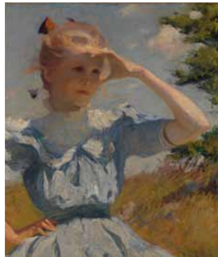
Frank W. Benson Eleanor , 1901 - Huile sur toile, 76,2 x 64,1 cm Providence, Museum of Art, Rhode Island School of Design, don de la succession de M me Gustav Radeke, 31.079