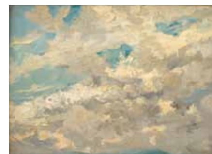
Hippolyte Boulenger Ciel nuageux , s.d. - Huile sur toile, 29,5 x 42 cm Bruxelles, musée d'Ixelles

La Belgique, qui a conquis son indépendance en 1830, connaît une prospérité exceptionnelle au cours du XIX e siècle. Forte d'une industrialisation particulièrement précoce et d'un contexte libéral propice, elle s'affichera dès la fin du siècle comme une des toutes premières puissances économiques mondiales. Cette effervescence économique engendre une urbanisation rapide accompagnée d'une explosion démographique, mais aussi d'un bouillonnement culturel sans précédent. La modernité se déploie en tous domaines, accompagnée de tensions sociales inhérentes à une période de mutation intense qui suscite des visions très contrastées. À l'image de cette société en plein essor, les artistes belges explorent des voies alternatives dès les années 1860.